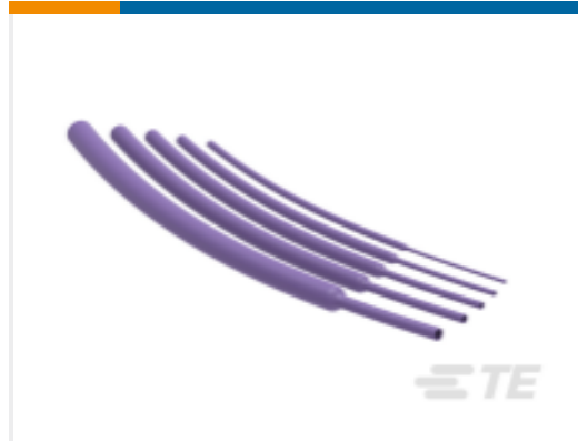
TE 产品编号NB43522001 RNF-100-3/64-7-STK