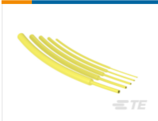
TE 产品编号NB15612001 RNF-100-3/64-YO-STK