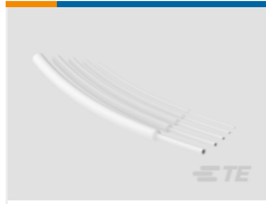
TE 产品编号NB15592001 RNF-100-3/64-WH-STK