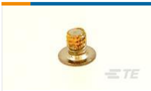
TE 产品编号1410946-1 MULTI-GIG SOC. CAP SCREW, CUSTOMIZED HDW