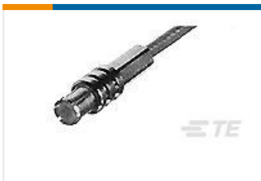
TE 产品编号1060875-2 MCX CABLE PLUG, CRIMP ATTACH