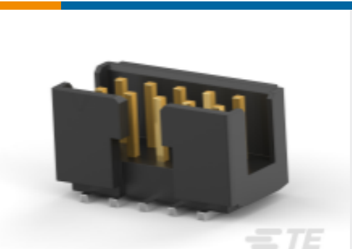
TE 产品编号1-2373376-0 10P,2MM,SHRD HDR,DRV,T,SMD,0.1 AU,TB