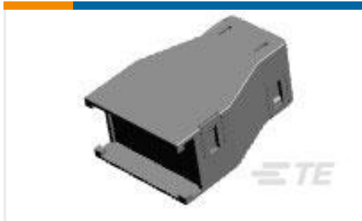
TE 产品编号1986185-1 Strain Relief,6 Posn,D5200 Dynamic. 2