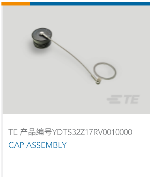
TE 产品编号YDTS32Z17RV0010000 CAP ASSEMBLY