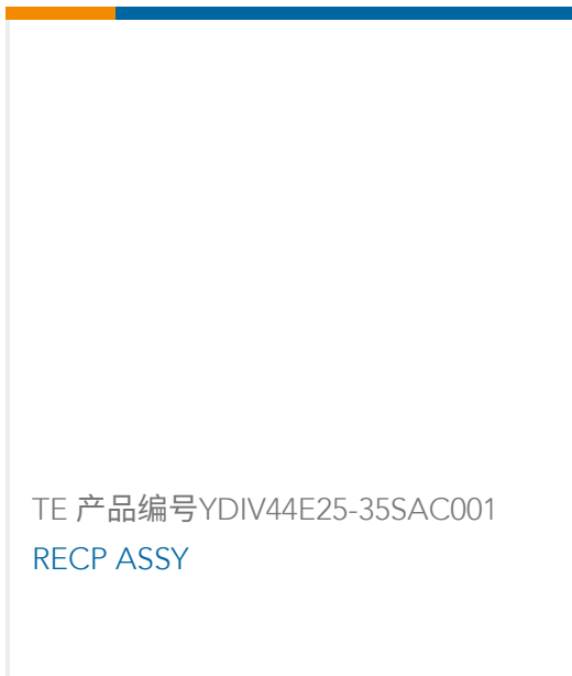
TE 产品编号YDIV44E25-35SAC001 RECP ASSY