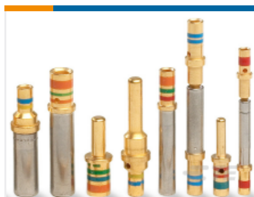
TE 产品编号0641-3-1231L CONT PIN