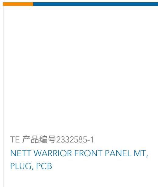
TE 产品编号2332585-1 NETT WARRIOR FRONT PANEL MT, PLUG, PCB