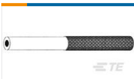
TE 产品编号F345203001 RAY-101-3.0(100)