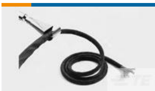
TE 产品编号CB03374007 RW-200-E-1/2-0-SP