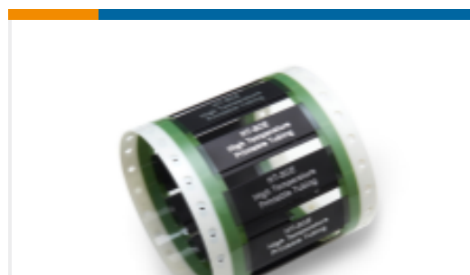
TE 产品编号8716810001 HT-SCE High Temperature Sleeves