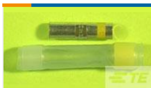
TE 产品编号695051-000 W-096-02