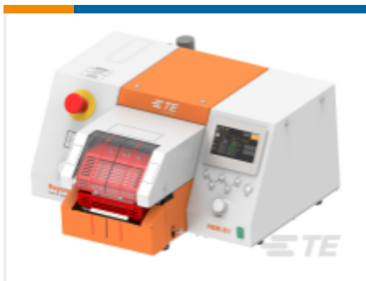
TE 产品编号 1-2234800-4 RBK-X1 CE, W/ AIR COOLING