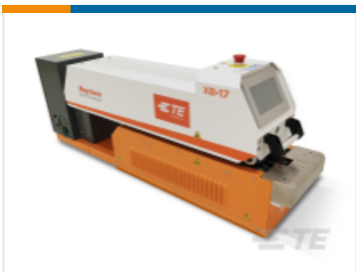
TE 产品编号 2375310-1 XB17 Belt Heater, 220V