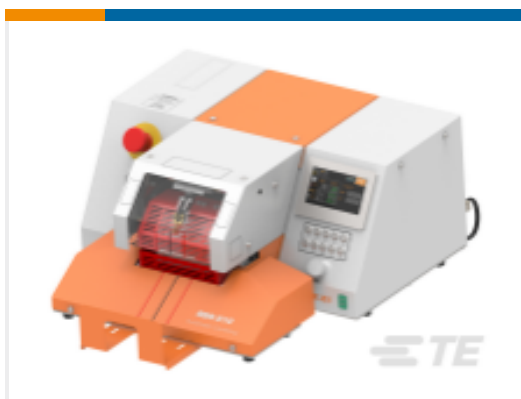
TE 产品编号 2376800-2 RBK-X1C CE STD