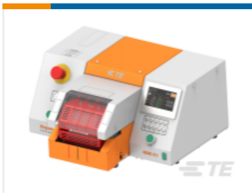
TE 产品编号 2234800-1 RBK-X1 STD