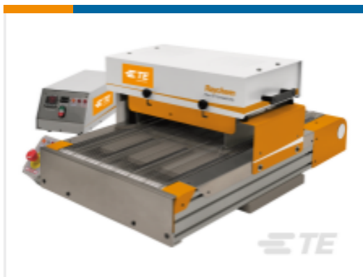
TE 产品编号 2326489-1 MODEL 105 TUNNEL OVEN, 36" ENTRY, STAND