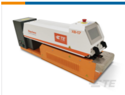
TE 产品编号 2375310-2 XB17 Belt Heater, 110V