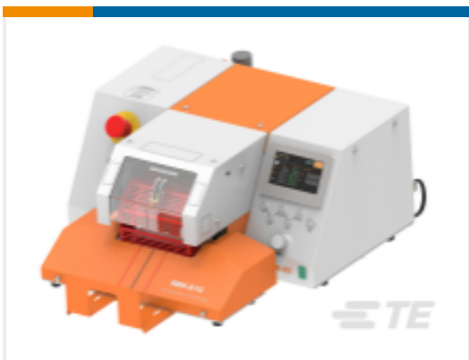
TE 产品编号 1-2376800-4 RBK-X1C CE, W/ AIR COOLING