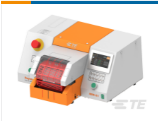
TE 产品编号 1-2234800-1 RBK-X1, AUTO TRIGGER