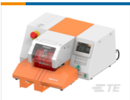
TE 产品编号 2376800-1 RBK-X1C STD