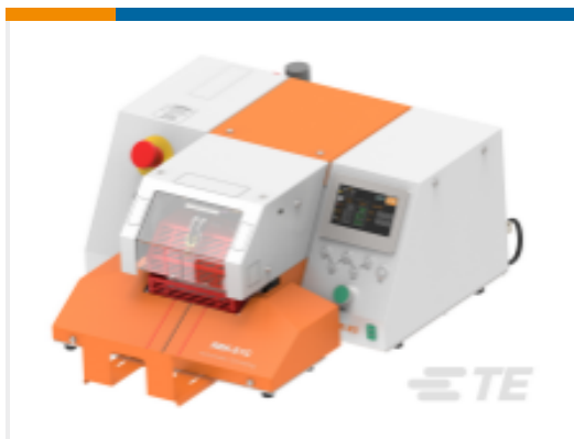
TE 产品编号 1-2376800-3 RBK-X1C, W/ AIR COOLING