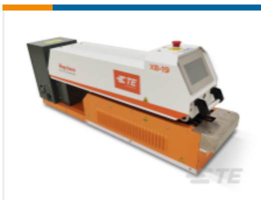
TE 产品编号 2375320-1 XB19 Belt Heater, STD