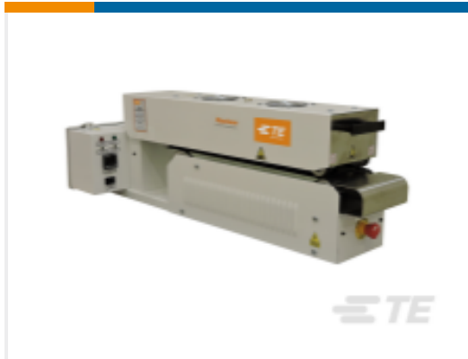
TE 产品编号 2280355-1 220 V MODEL 17