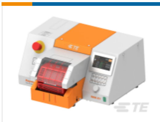
TE 产品编号 2234800-2 RBK-X1 CE STD