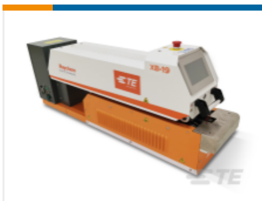
TE 产品编号 2375320-2 XB19 Belt Heater, 150mm (6") Version