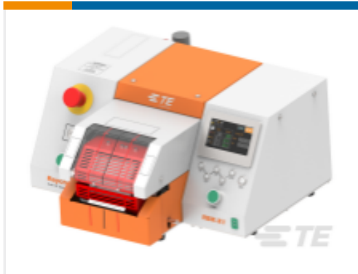
TE 产品编号 1-2234800-3 RBK-X1, W/ AIR COOLING