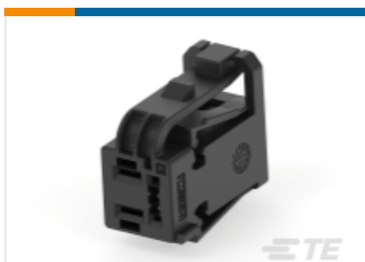
TE 产品编号1-2035077-1 PLUG HSG, 4 POSN HYBRID 0.64/2.8