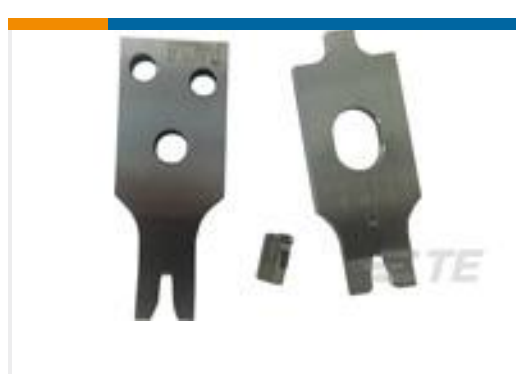
TE 产品编号7-2151495-7 OCEAN_2.0_SPARE_PART_KIT-140F