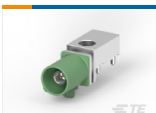
TE 产品编号5-2287903-5 FAKRA, 1 POS, EDGE MOUNT, 6 OCLOCK ASSY