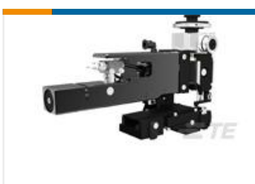
TE 产品编号2151067-2 OCEAN_2.0_APPLICATOR-S- 100F140O-RSA