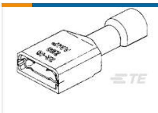
TE 产品编号3-350819-2 ULTRA-FAST 250 ASY REC 16-14 AWG TPBR