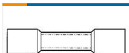
TE 产品编号55845-1 #8 PRE-INSUL SEALED SPLICE