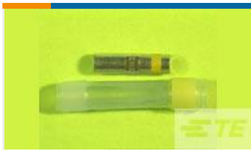
TE 产品编号 650075-000 D-436-37