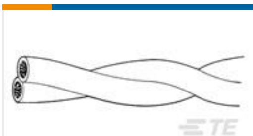
TE 产品编号CZ1343-000 82A0121-12-9/96