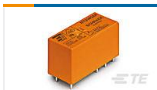
TE 产品编号3-1393240-5 RT33L024