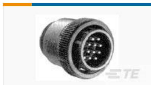
TE 产品编号206305-1 CPC PLUG ASSEMBLY SIZE 23-37