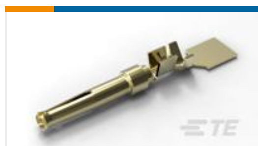
TE 产品编号5-166051-1 HD 20 SOCKET ON MINI-REEL 500