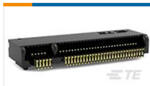
TE 产品编号2199119-3 M.2 0.5PITCH 3.2H KEY B 15U" AU