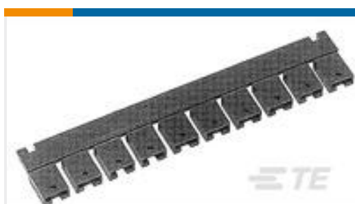
TE 产品编号2-382811-1 SHUNT, ECON, PHBRSN, BLACK