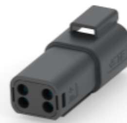
TE 产品编号1-2600030-0 4CCT BLACK RECF W/LARGE SEAL