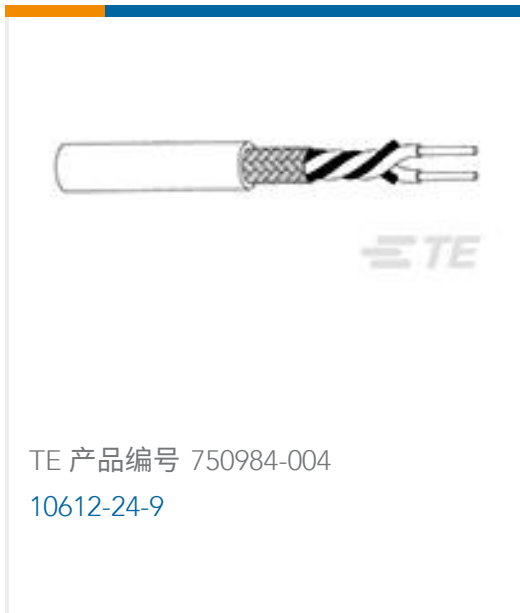
TE 产品编号 750984-004 10612-24-9