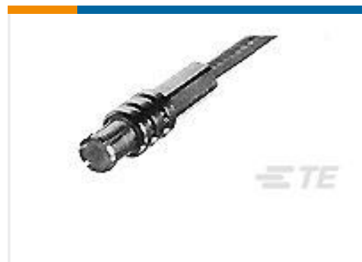
TE 产品编号1060875-2 MCX CABLE PLUG, CRIMP ATTACH