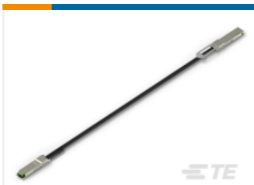
TE 产品编号2333393-3 30 AWG QSFP28 对 QSFP28 电缆组件