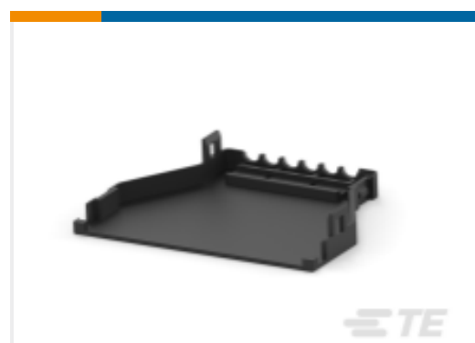
TE 产品编号1776695-1 Strain Relief, D5200, Dynamic