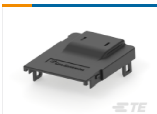
TE 产品编号1986186-1 Strain Relief,20 Posn,D3000 Dynamic, 2