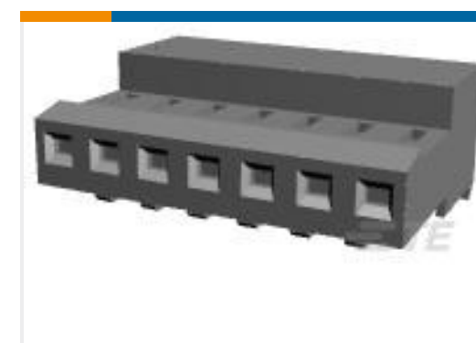
TE 产品编号3-644426-7 07P MTA100 CONN ASSY W/O#5