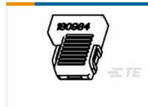
TE 产品编号8-180984-1 FASTON 250 FLAG BOOT HSG NYLON BLK