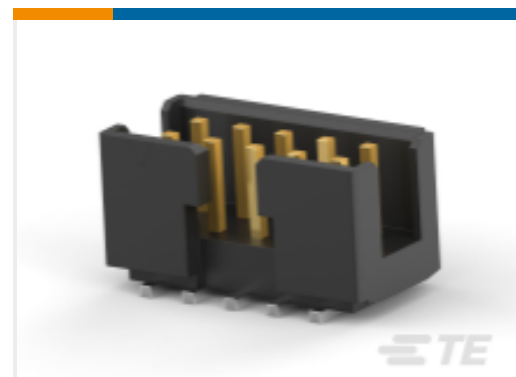
TE 产品编号1-2373376-0 10P,2MM,SHRD HDR,DRVT,SMD,0.1 AU,TB