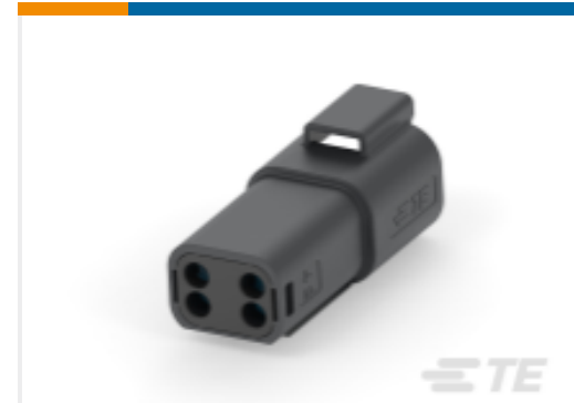
TE 产品编号1-2600030-0 4CCT BLACK RECEP W/LARGE SEAL