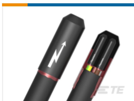
TE 产品编号973301-000 EPKE-0024-(S25)