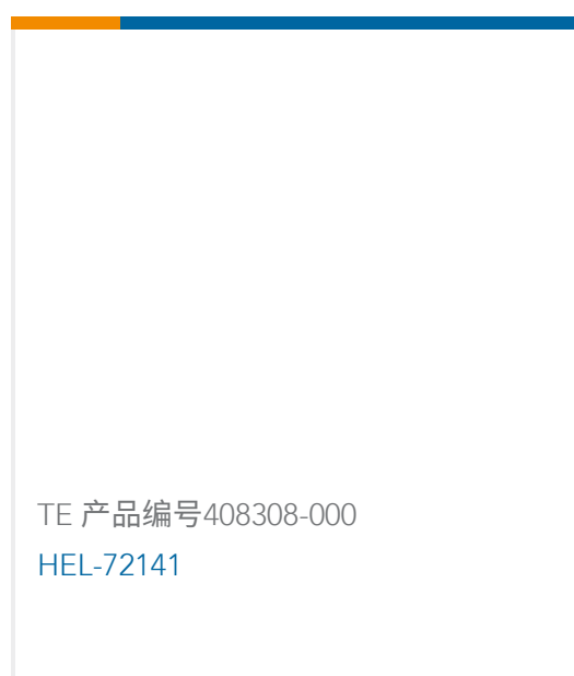
TE 产品编号408308-000 HEL-72141