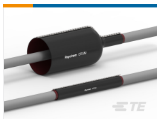
TE 产品编号316675-000 CRSM-34/10-250/239(S10)