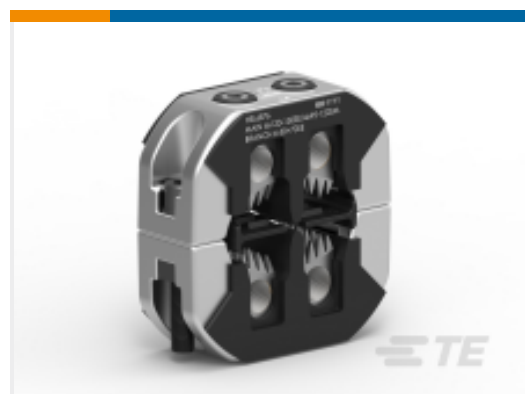
TE 产品编号C32903-000 HEL-6878