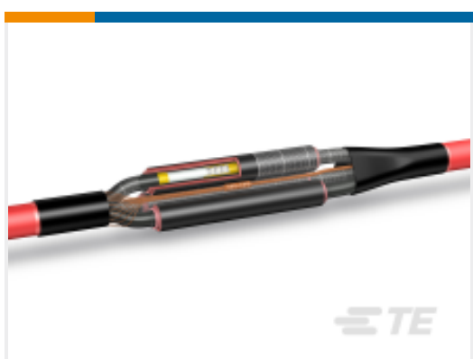
TE 产品编号676955-000 EPKJ-0228-(S10)