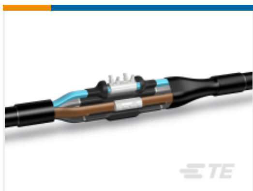
TE 产品编号BM9736-000 LJSM-5X004-016-PP