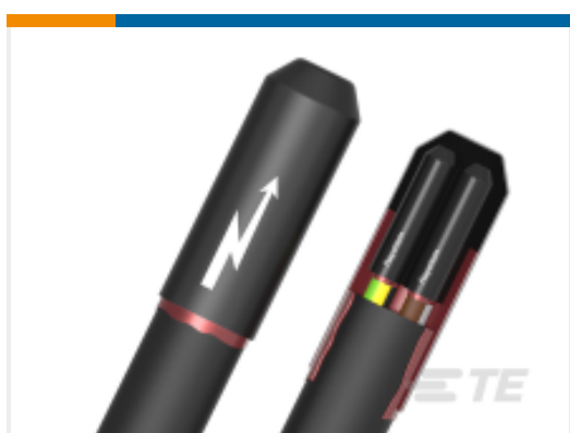
TE 产品编号248047-000 EPKE-0064-DE01