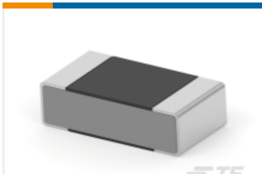
TE 产品编号6-1879417-3 CPF0603 536K 0.1% 25PPM 1K RL