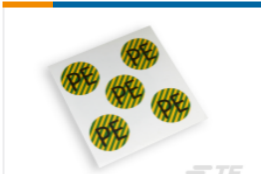
TE 产品编号7-1768034-3 LKZ Vinyl Electric Symbol Labels