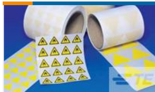
TE 产品编号4-1768018-2 EET-1325P-4