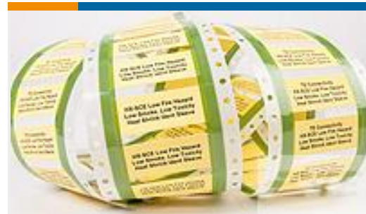
TE 产品编号C28032-000 HX-SCE-2.5K-6.4-50-4