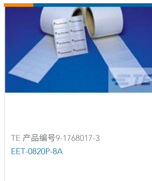
TE 产品编号9-1768017-3 EET-0820P-8A