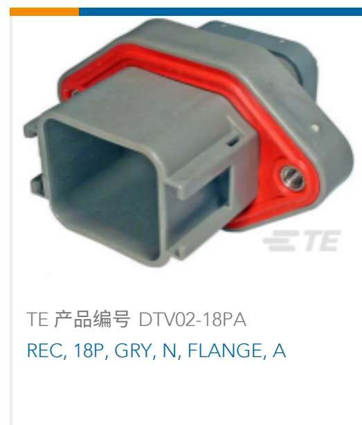
TE 产品编号 DTV02-18PA REC, 18P, GRY, N, FLANGE, A