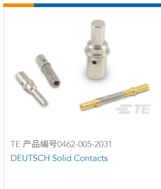
TE 产品编号0462-005-2031 DEUTSCH Solid Contacts