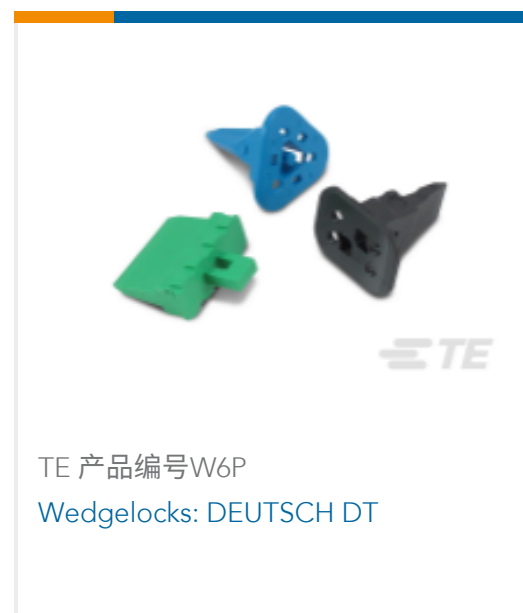
TE 产品编号W6P Wedgelocks: DEUTSCH DT