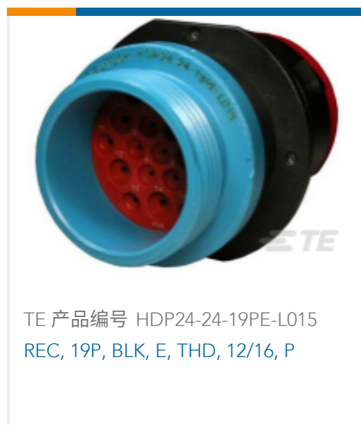
TE 产品编号 HDP24-24-19PE-L015 REC, 19P, BLK, E, THD, 12/16, P