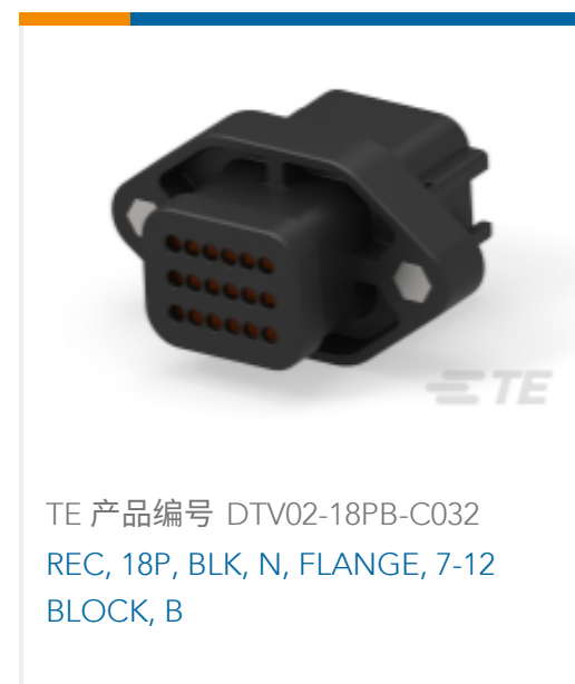
TE 产品编号 DTV02-18PB-C032 REC, 18P, BLK, N, FLANGE, 7-12 BLOCK, B