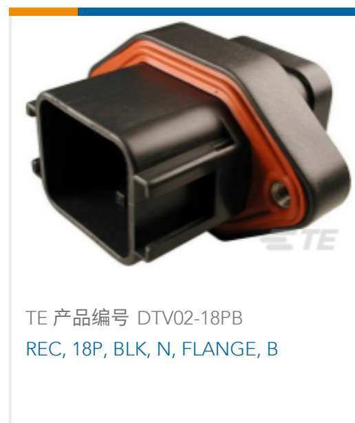
TE 产品编号 DTV02-18PB REC, 18P, BLK, N, FLANGE, B