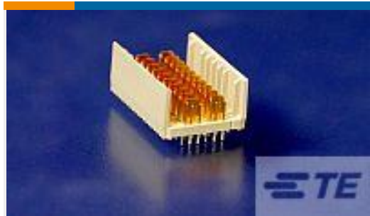
TE 产品编号6469076-1 HM-ZD 2PR HDR ASSY 1.8MM