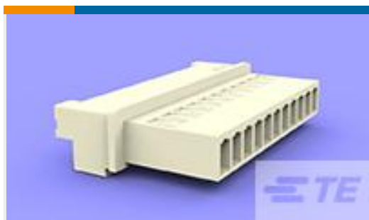
TE 产品编号1969588-2 HSG, REC, FREE-HANGING, SINGLE ROW,EP2.5