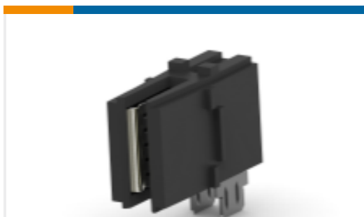
TE 产品编号2178410-1 CROWN CLIP JUNIOR CONN