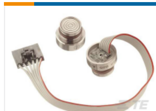
TE 产品编号85-015G-FC 15 PSIG FLUSH MOUNT PRESSURE SENSOR