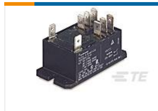
TE 产品编号1393212-5 T92S7A22-240