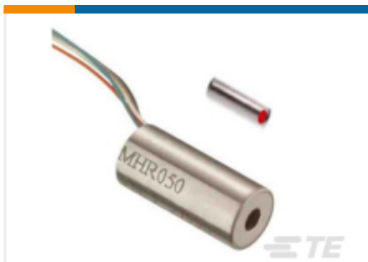
TE 产品编号02560408-000 小型轻量 LVDT