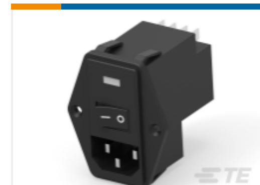
TE 产品编号6609929-7 PE0SXDHX0=C2221