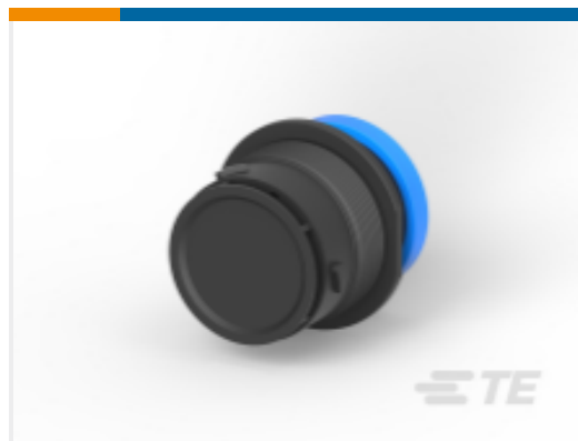
TE 产品编号HDP24-24-18PE-L017 REC, 18P, BLK, E, RNG, 8/12/16, P