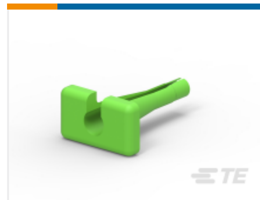
TE 产品编号114008-ZZ EXT TOOL, SIZE 8, 8-10 AWG, N, GRN