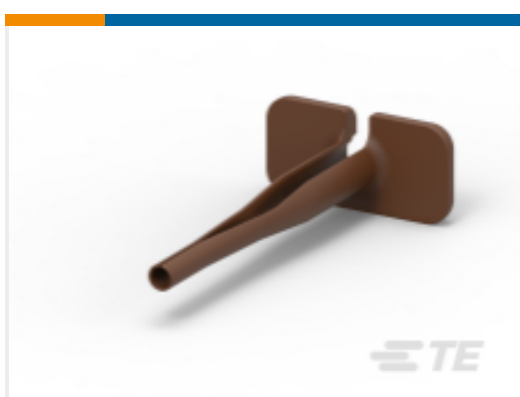
TE 产品编号0411-354-1605 EXT TOOL, SIZE 16, 16-18 AWG, N, BRN