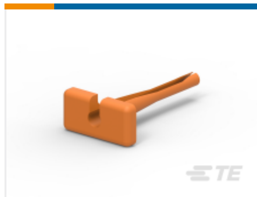
TE 产品编号0411-337-1205 EXT TOOL, SIZE 12, 12-14 AWG, E, ORG