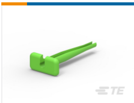
TE 产品编号0411-291-1405 EXT TOOL, SIZE 16, 14-16 AWG, N, GRN