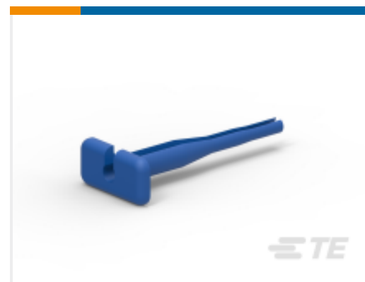
TE 产品编号0411-310-1605 EXT TOOL, SIZE 16, 16-18 AWG, T, LT BLU