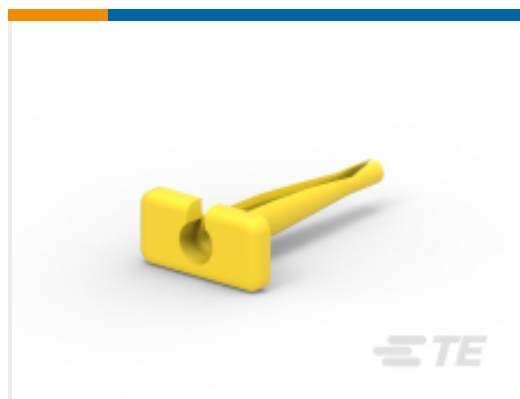
TE 产品编号114010-ZZ EXT TOOL, SIZE 12, 12 AWG, N, YEL