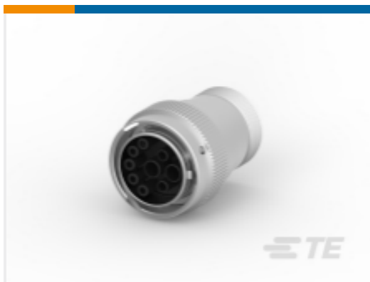
TE 产品编号HD36-24-91SN-059 PLG,9P,AL,N,CBLCLMPBT,DRAIN,8/12/16,S,MC