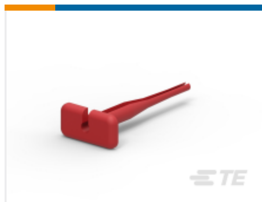
TE 产品编号0411-240-2005 EXT TOOL, SIZE 20, 16-22 AWG, N, RED