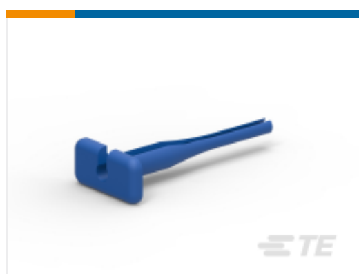
TE 产品编号0411-336-1605 EXT TOOL, SIZE 16, 16-20 AWG, E, DRK BLU