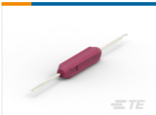
TE 产品编号DT-RT1 EXT TOOL, FRONT RELEASE