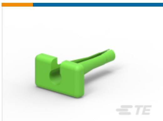
TE 产品编号114008-ZZ EXT TOOL, SIZE 8, 8-10 AWG, N, GRN