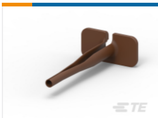
TE 产品编号0411-354-1605 EXT TOOL, SIZE 16, 16-18 AWG, N, BRN