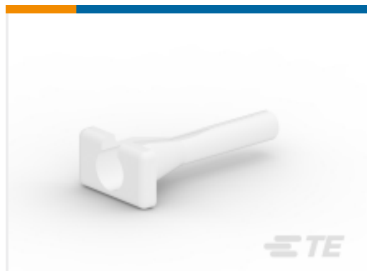
TE 产品编号114009-ZZ EXT TOOL, SIZE 4, 6 AWG, N, WHT ORG