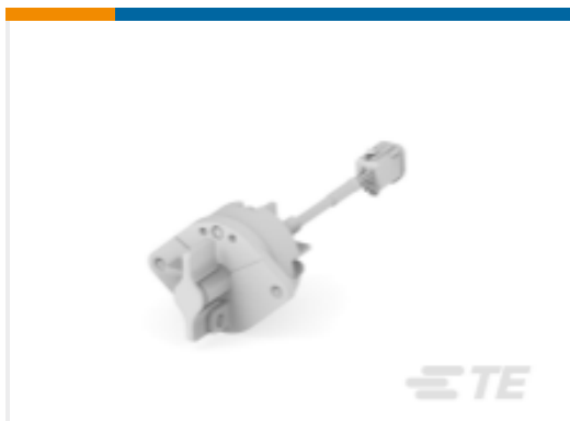
TE 产品编号K1160527 Battery Disconnecter 35-524-231-R-A-908