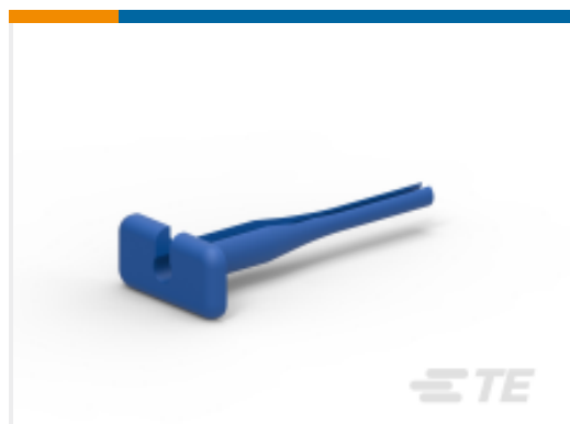
TE 产品编号0411-336-1605 EXT TOOL, SIZE 16, 16-20 AWG, E, DRK BLU