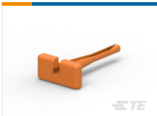
TE 产品编号0411-337-1205 EXT TOOL, SIZE 12, 12-14 AWG, E, ORG