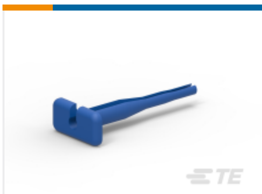
TE 产品编号0411-310-1605 EXT TOOL, SIZE 16, 16-18 AWG, T, LT BLU