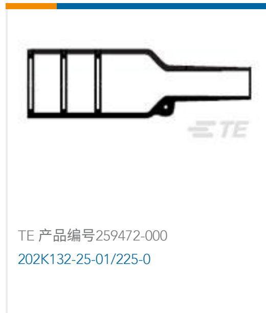
TE 产品编号259472-000 202K132-25-01/225-0