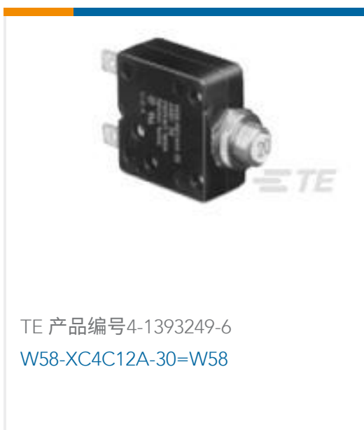
TE 产品编号4-1393249-6 W58-XC4C12A-30=W58