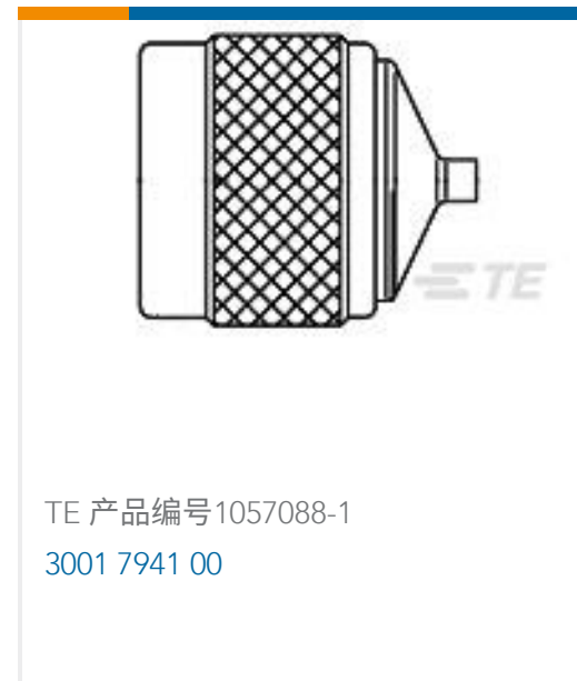
TE 产品编号1057088-1 3001 7941 00