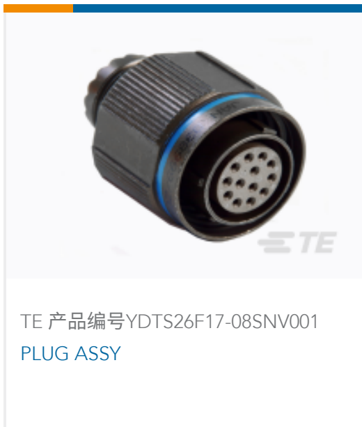
TE 产品编号YDTS26F17-08SNV001 PLUG ASSY