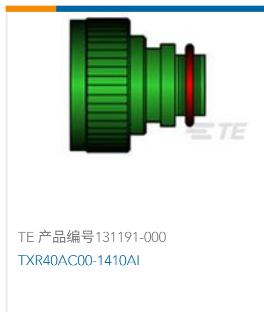
TE 产品编号131191-000 TXR40AC00-1410AI