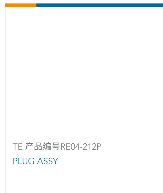
TE 产品编号RE04-212P PLUG ASSY