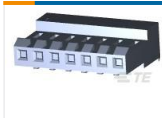
TE 产品编号3-640427-7 07P MTA156 CONN ASSY 20AWG YEL