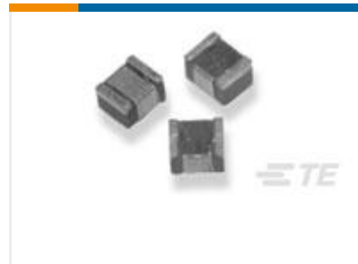
TE 产品编号2-1624112-6 3650 0402 36nH 5% 2K RL