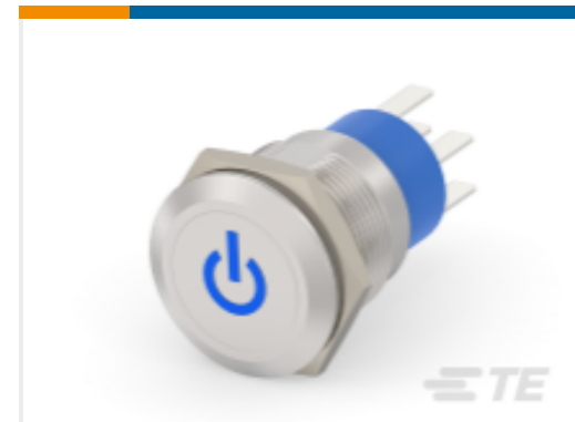
TE 产品编号7-2213766-7 AV19 DPL 5A POWER LED BLUE 12V