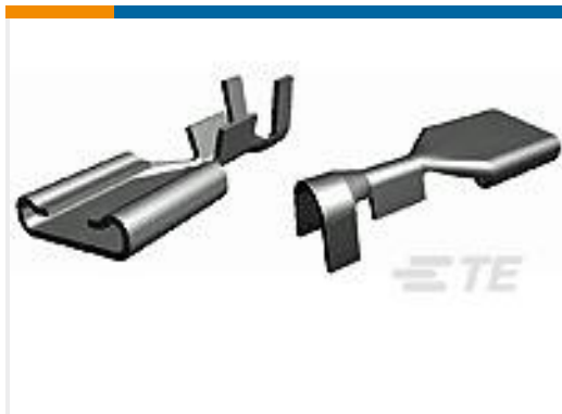
TE 产品编号61202-1 250 FASTON REC 26-22 AWG BR