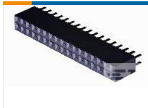
TE 产品编号1-534998-7 34 MODIV VRT DR CE 100/125