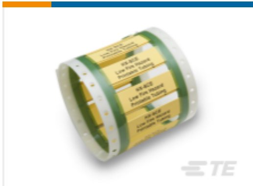
TE 产品编号A29688-000 HX-SCE Low Fire Hazard Sleeves