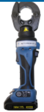
TE 产品编号 2107725-1 AUTOPRESS L62+ COF+CHARG