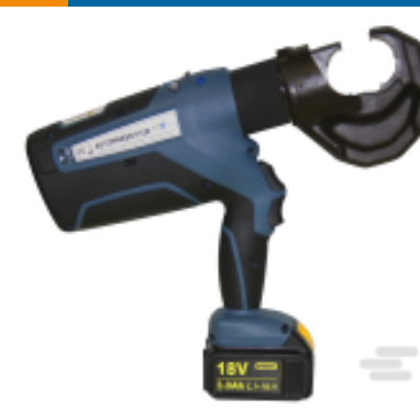
TE 产品编号 2107733-4 AUTOPRESS C120 18V+COF+CHARG 110V