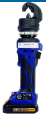
TE 产品编号 2107475-2 UNIPRESS 6/120 +COF+CHARG