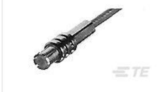
TE 产品编号1060875-2 MCX CABLE PLUG, CRIMP ATTACH