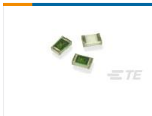
TE 产品编号6-1879127-7 RN 0402 422R 0.1% 10PPM CUT LENGTH