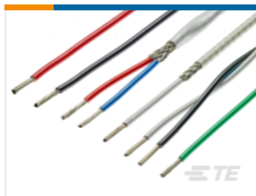
TE 产品编号2611473001 44A0111-12-54