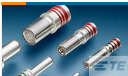
TE 产品编号 0662-207-0082 CONT SOC ASSY