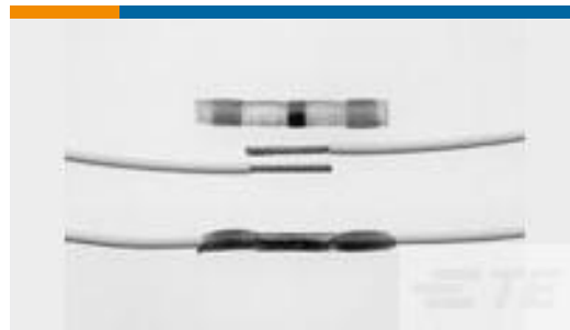
TE 产品编号D33598-000 B-152-9003