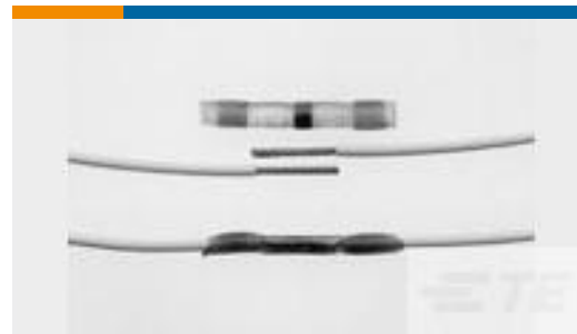
TE 产品编号F80600-000 B-152-9004