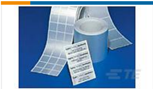
TE 产品编号C57207-000 MP-381127-5-8A