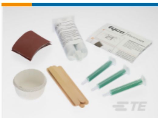
TE 产品编号 657863-000 S1125-KIT-8