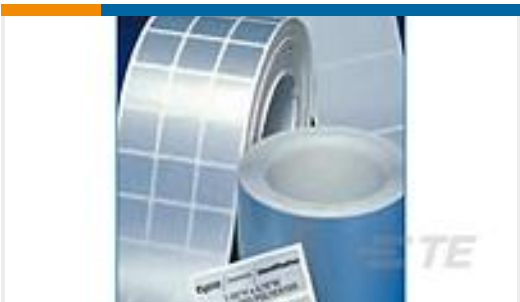
TE 产品编号A51165-000 WP-318097-10-9