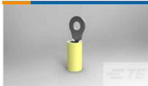
TE 产品编号320568 TERMINAL,PIDG R 12-10 8