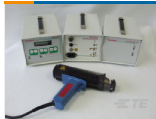
TE 产品编号CF0024-000 IR1759-MK4-AT3130-EDCONT