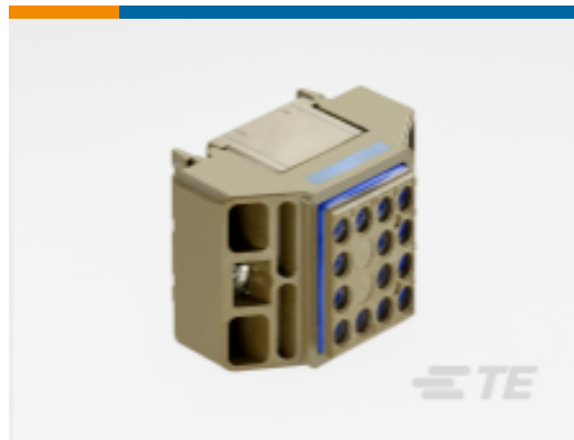
TE 产品编号SLDE205B10A12116 SLDE205B10A12116=SOCKET