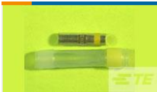
TE 产品编号650075-000 D-436-37