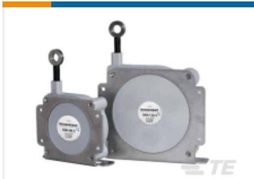
TE 产品编号SGD-120-3 STRING POT, 120 INCH RANGE