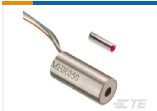
TE 产品编号05282946-006 ROD CORE #4-40 6"L