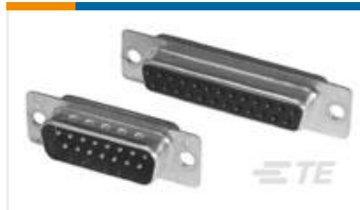
TE 产品编号5-747908-2 15 Plug Solder Cup, Gold Flash