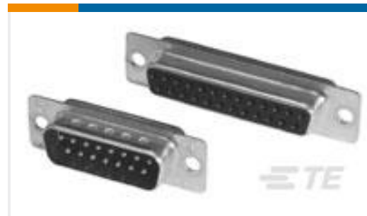
TE 产品编号5-747909-2 15 Rcpt Solder Cup, Gold Flash