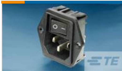
TE 产品编号1-1609112-2 15CE1=F8272