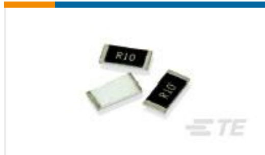
TE 产品编号6-1622824-7 RL73N 1J R33 5% 5K RL