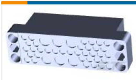
TE 产品编号202516-3 42 POS. FEMALE RECP. BLOCK