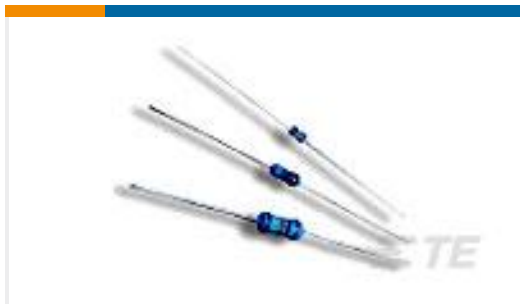
TE 产品编号1622796-6 YR1 0.1% 10K