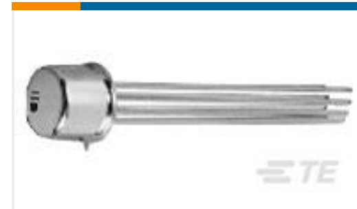
TE 产品编号2-1617118-0 J1MACD-26XM = M39016/23-030M