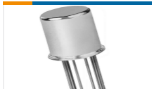
TE 产品编号1-1617118-9 J1MACD-26XL = M39016/23-030L