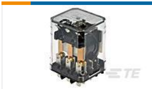
TE 产品编号8-1393116-4 KUMP-14A18-120=KU