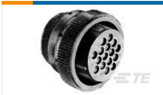
TE 产品编号182651-1 CPC Plug Assy, 11-4, Rev Sex