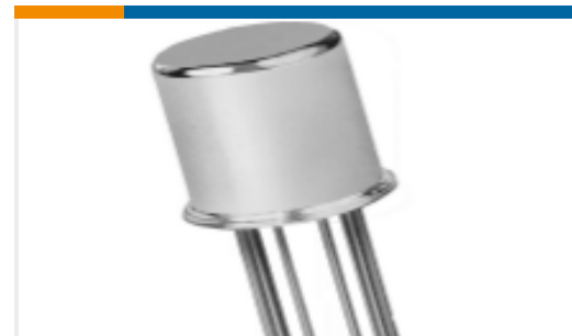
TE 产品编号1617168-3 JMSCT-18XL = M28776/3-037L