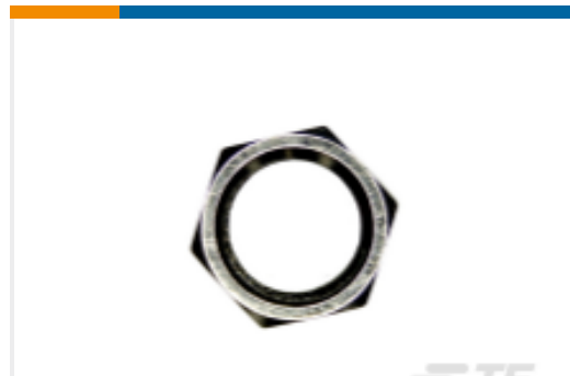
TE 产品编号NT-SMA-N Nut Nickel SMA Connectors RoHS