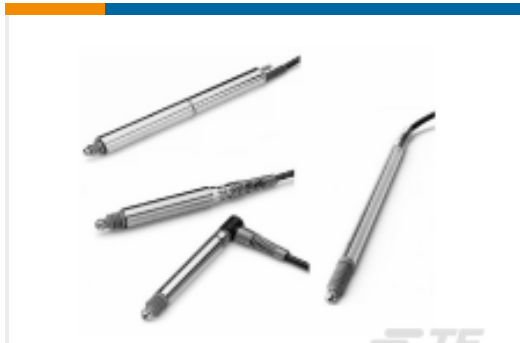
TE 产品编号67010001-000 CONTACT TIP #9