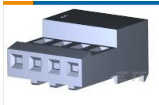
TE 产品编号3-640442-4 04P MTA100 CONN ASSY BLU