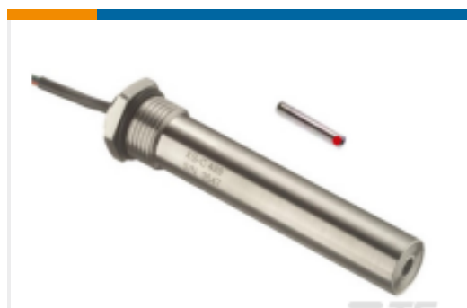
TE 产品编号02560551-000 LVDT XS-C 249 ASSY