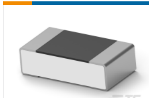
TE 产品编号5-2176371-3 RQ 0603 16K2 0.1% 10PPM 5K RL