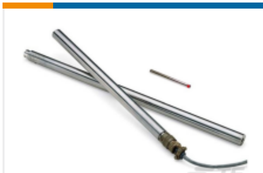
TE 产品编号05282977-006 ROD CORE MTRC M3X0.5 6"L