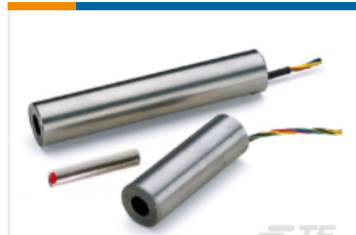
TE 产品编号02560391-000 LVDT HR 200 ASSY