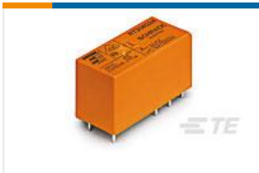
TE 产品编号7-1393243-9 RT424730