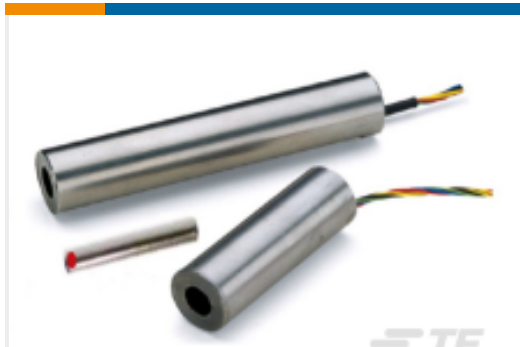
TE 产品编号02560390-000 LVDT HR 100 ASSY