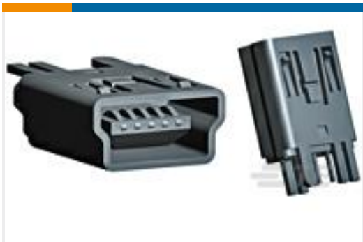
TE 产品编号2041517-1 MINI USB, RCPT, V/T, DIP, B TYPE, 30u" Au