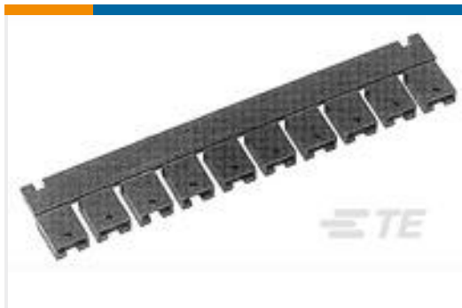
TE 产品编号382811-6 SHUNT, ECON, PHBR 15 AU, BLACK