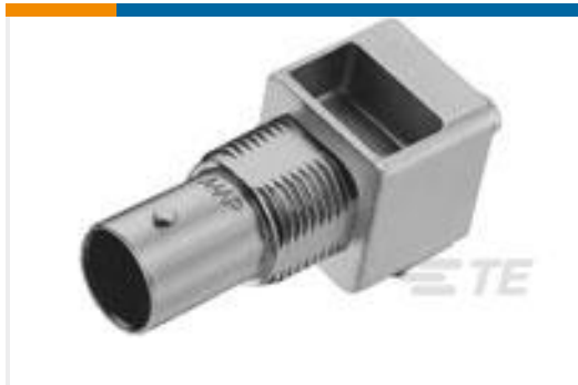
TE 产品编号5227677-1 BNC PCB RT ANG JACK W/POST