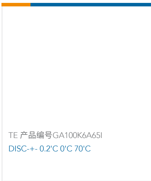
TE 产品编号GA100K6A65I DISC +/- 0.2°C 0°C 70°C