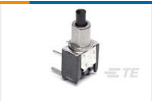
TE 产品编号1825095-1 TP11CGPC004