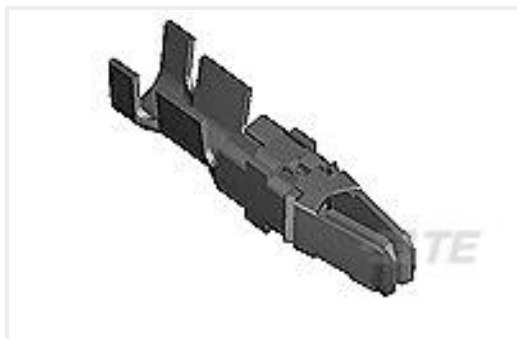
TE 产品编号2-66740-1 TYPE XII FEMALE CONT (LP)