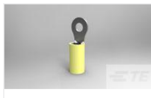
TE 产品编号321021 PIDG RING (26-22)