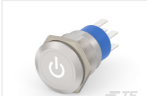
TE 产品编号6-2213766-3 AV19 DPL 3A POWER LED WHITE 24V