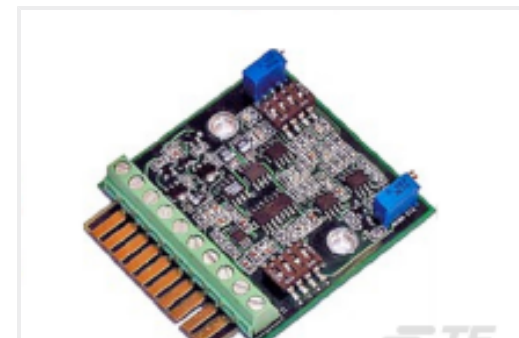
TE 产品编号04171776-000 LVM-110 AMP/DEMOM BD ASSY 8MM,LEON