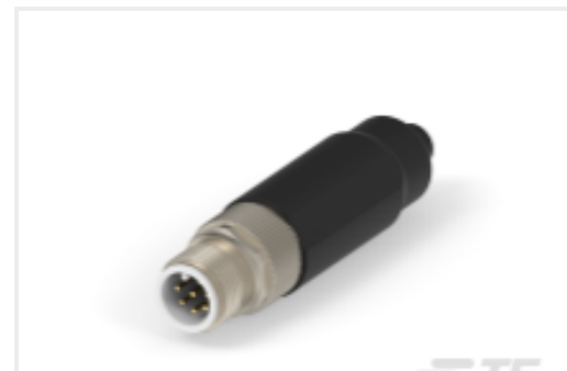
TE 产品编号1-2823447-2 M12 A-M-8,CAT7 BETATRANS C-FLE8. 8MM,LEON