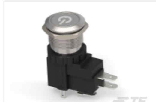
TE 产品编号1-2364574-9 AVH19 FLT SS MT PWR BLU 24V16A