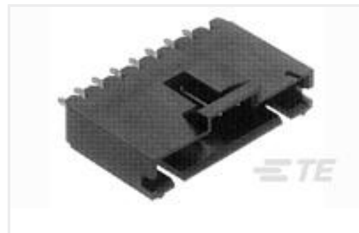
TE 产品编号5-103639-4 05 MTE HDR SRST LATCH .100CL