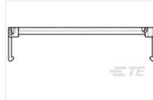
TE 产品编号746785-1 50 POS STR RLF,LOW PROFILE