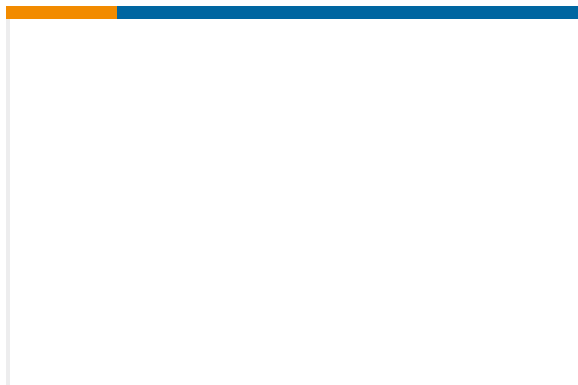
TE 产品编号385Z-05322 Speed sen F12A