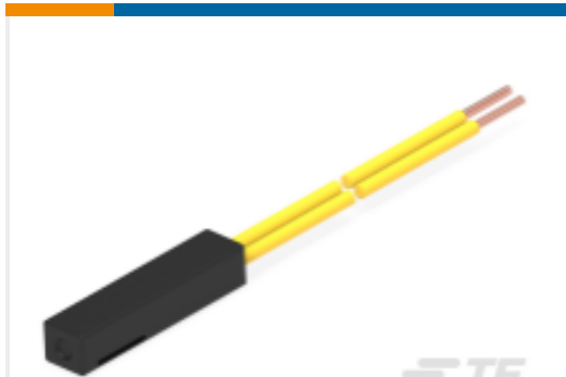
TE 产品编号20026452-00 High power connector NTC temp sensor