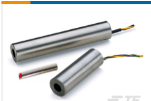
TE 产品编号02560396-000 LVDT HR 2000 ASSY