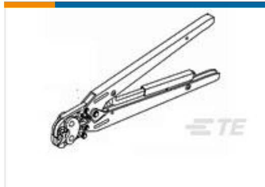
TE 产品编号46447 DAHT STRATO 22-10 ASSY