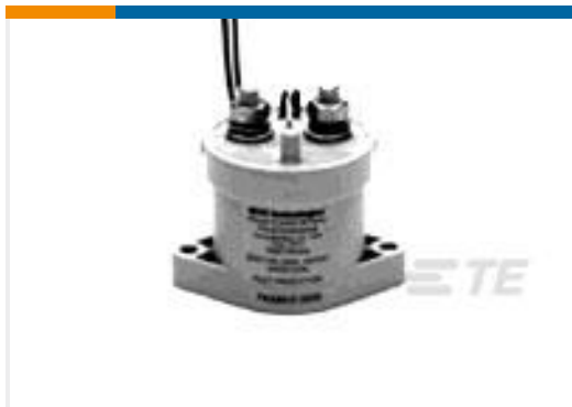
TE 产品编号1618002-5 EV200AAACA=RELAY, EV200 SPST-N