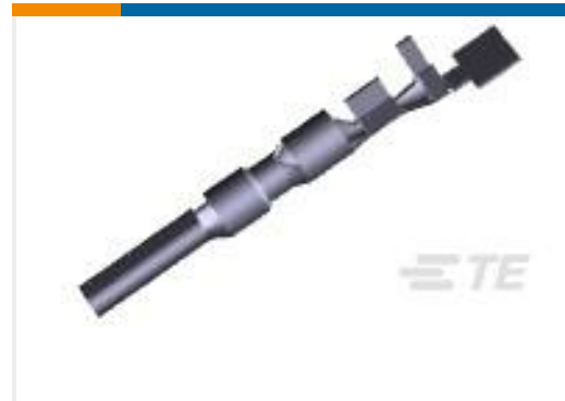
TE 产品编号1-794227-0 MINI UMNL2 SOK 26-22 AWG LP LF