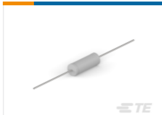
TE 产品编号9-2176412-7 5W XSM M/OX 5% 51K