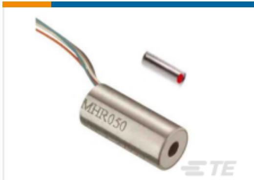
TE 产品编号02560411-000 LVDT MHR 500 ASSY