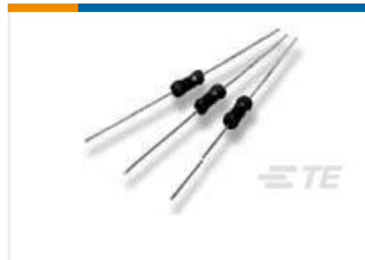
TE 产品编号3-1879354-3 RR03 5% 6R8 AMMO