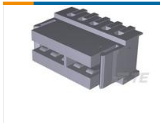
TE 产品编号284865-5 Direct mount card edge conn.,