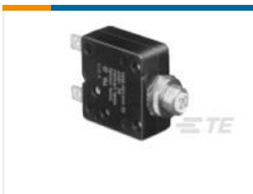
TE 产品编号1393249-7 W58-XB1A4A-10=W58