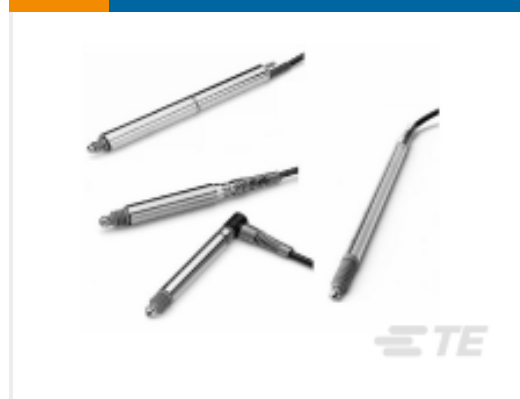
TE 产品编号67010005-000 CONTACT TIP #2