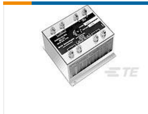
TE 产品编号1-1618065-4 1810DBX=WILMAR PARALLELING RE