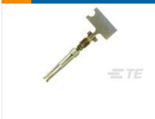
TE 产品编号66505-9 SOCKET CONTACT, 20 DF