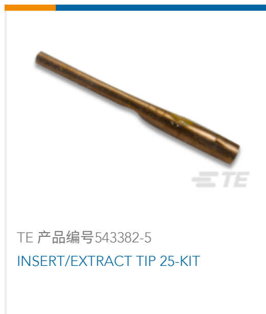
TE 产品编号543382-5 INSERT/EXTRACT TIP 25-KIT