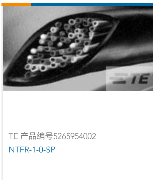
TE 产品编号5265954002 NTFR-1-0-SP