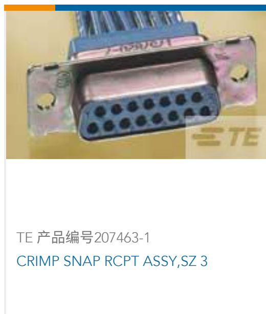
TE 产品编号207463-1 CRIMP SNAP RCPT ASSY,SZ 3