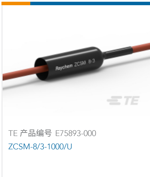
TE 产品编号 E75893-000 ZCSM-8/3-1000/U