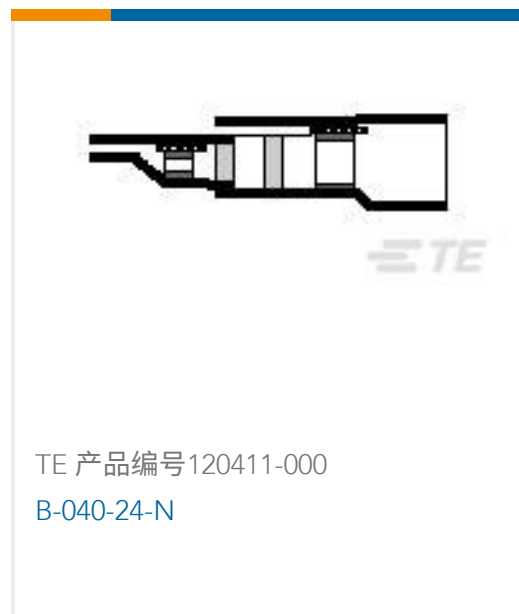
TE 产品编号120411-000 B-040-24-N