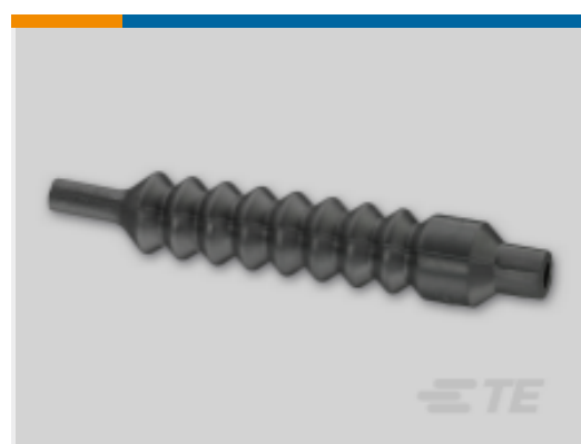
TE 产品编号F67100-000 202C653-770-0