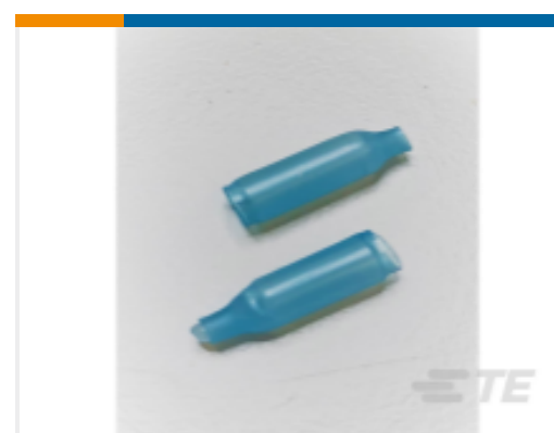
TE 产品编号039695-000 CTA-0013