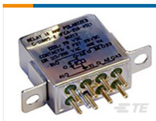
TE 产品编号1-1617749-5 FCA-210-1020M=M83536/10-020M