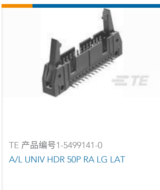
TE 产品编号1-5499141-0 A/L UNIV HDR 50P RA LG LAT