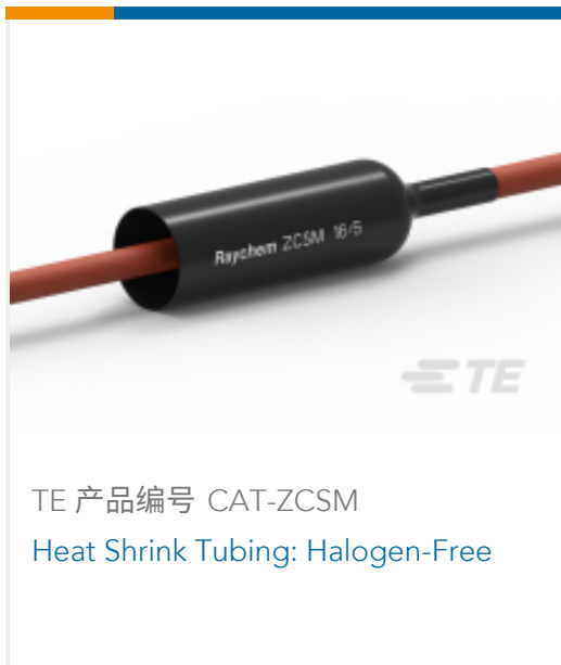
TE 产品编号 CAT-ZCSM Heat Shrink Tubing: Halogen-Free