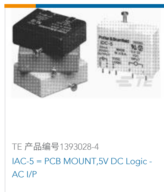
TE 产品编号 1393028-4 IAC-5 = PCB MOUNT, 5V DC Logic - AC I/P