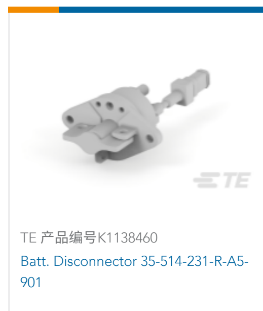
TE 产品编号K1138460 Batt. Disconnecter 35-514-231-R-A5-901