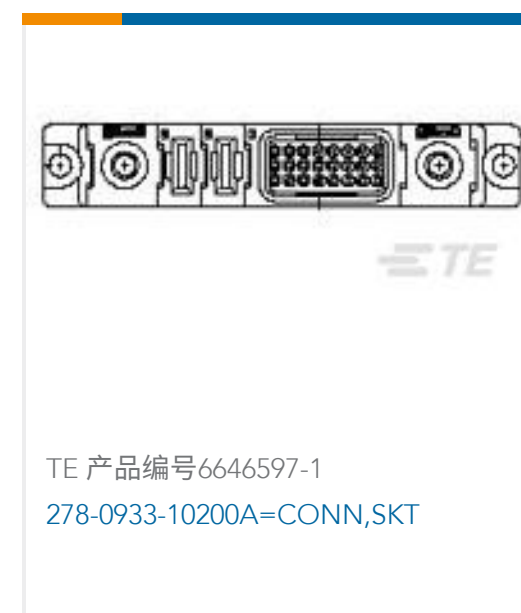
TE 产品编号6646597-1 278-0933-10200A=CONN,SKT