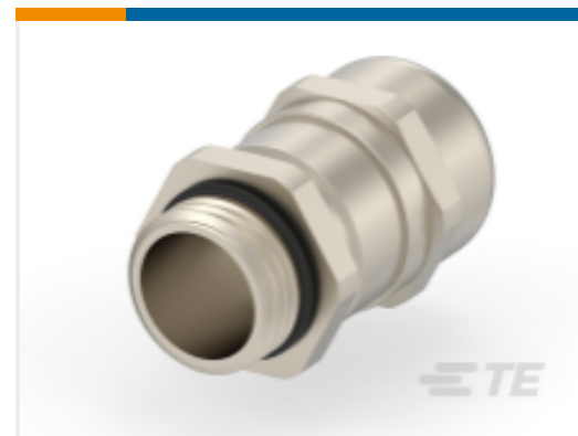
TE 产品编号1SNG613005R0000 EM-EMC2-M16-MET-C