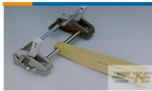
TE 产品编号993850-000 AD-1319-9