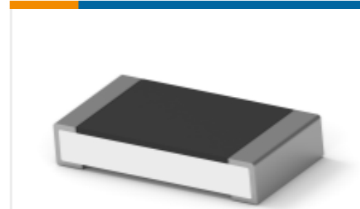
TE 产品编号9-2176389-1 RQ 1206 931R 0.1% 10PPM 5K RL