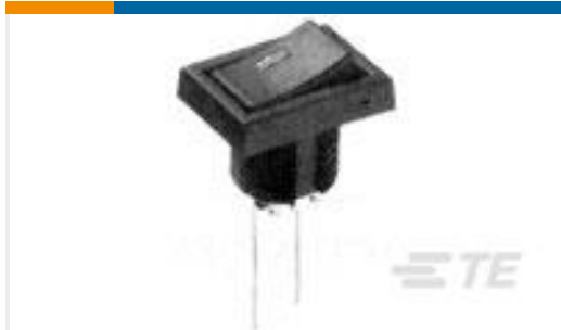
TE 产品编号1825420-1 TRD13D10WL04 rocker switch