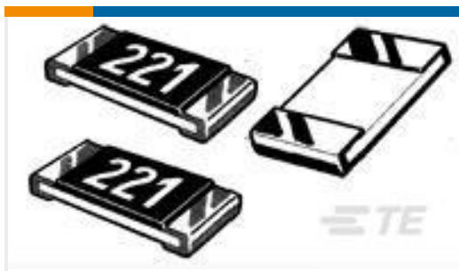
TE 产品编号4-2176070-7 3521 820R 1% 2W