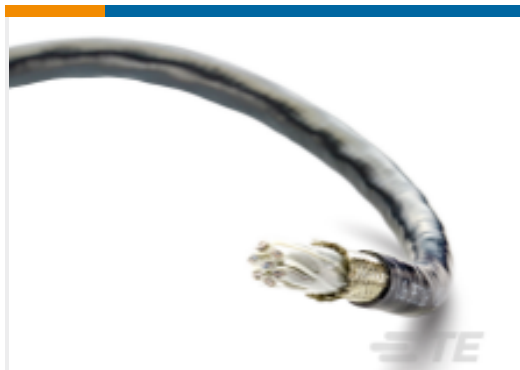
TE 产品编号8163673001 VG-95218-T025-G004