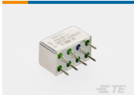
TE 产品编号ES2050402CTM ES2050402CTM=RELAY