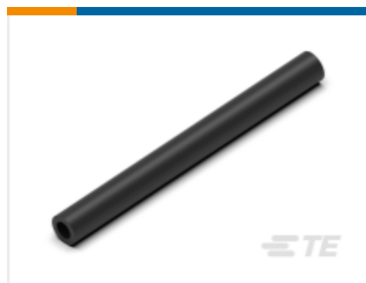
TE 产品编号E00758-000 EN-CGAT-3/1-0-SP