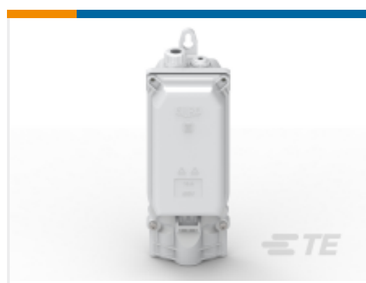
TE 产品编号619568-000 EKM-1281-1D2-5X16-2PG-C3