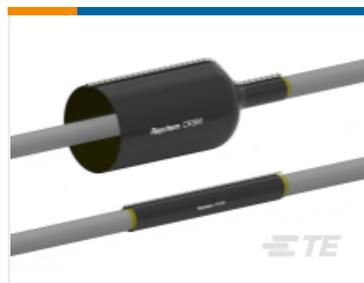
TE 产品编号EN3764-000 CRSM-53/13-1500/250(S1)