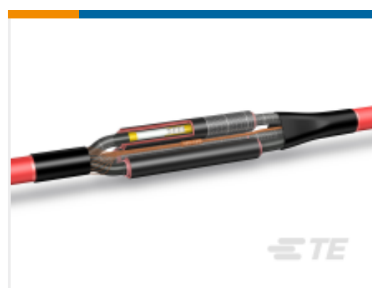
TE 产品编号634139-000 EPKJ-0910-(S5)