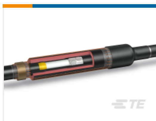
TE 产品编号F12535-014 POLJ-12/1X120-240