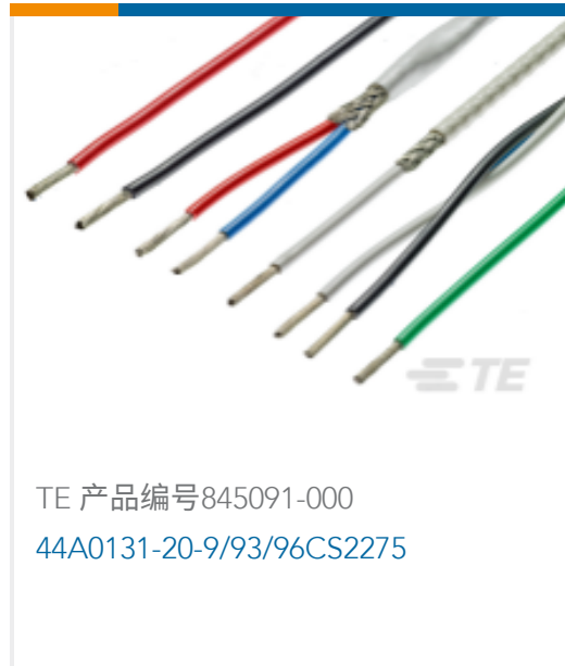
TE 产品编号845091-000 44A0131-20-9/93/96CS2275