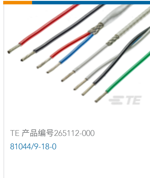
TE 产品编号265112-000 81044/9-18-0