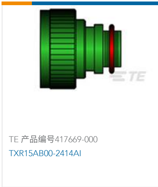
TE 产品编号417669-000 TXR15AB00-2414AI