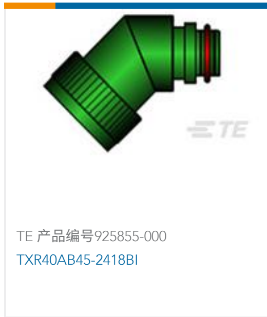
TE 产品编号925855-000 TXR40AB45-2418BI