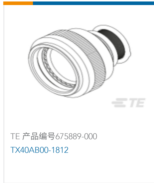
TE 产品编号675889-000 TX40AB00-1812