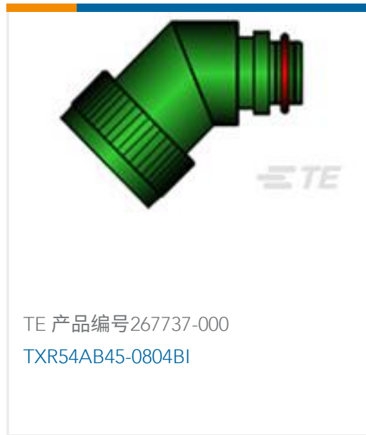
TE 产品编号267737-000 TXR54AB45-0804BI