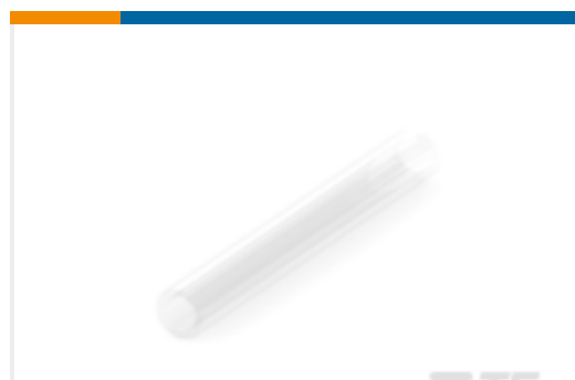
TE 产品编号7121976001 RBK-VWS 热缩管