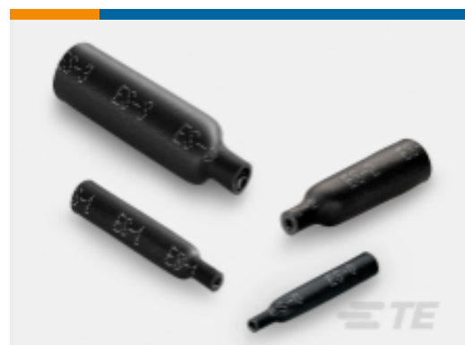
TE 产品编号1335390003 接头密封端盖 (ES 帽)