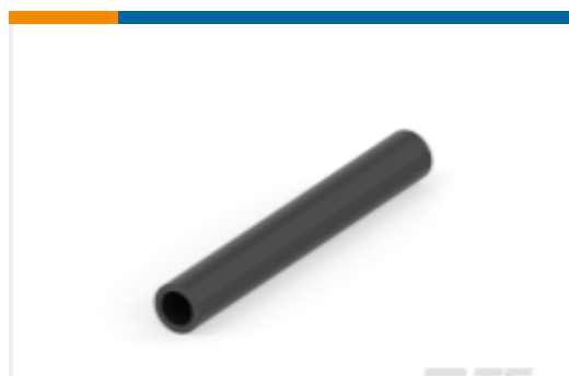
TE 产品编号CH03612001 QSZH 热缩管