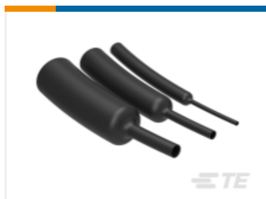
TE 产品编号3079216001 RNF-3000-NR555-0-40MM