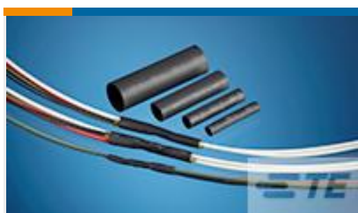
TE 产品编号2525596010 RBK-ILS-125-NR1-0-27MM