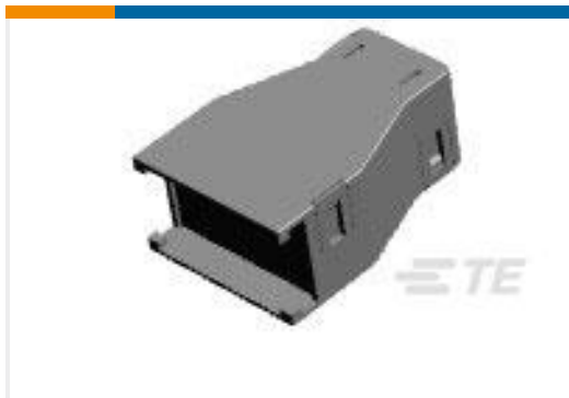
TE 产品编号1986185-1 Strain Relief,6 Posn,D5200 Dynamic. 2