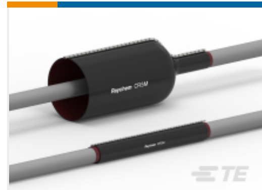
TE 产品编号318575-000 CRSM-198/55-1000/239(S1)