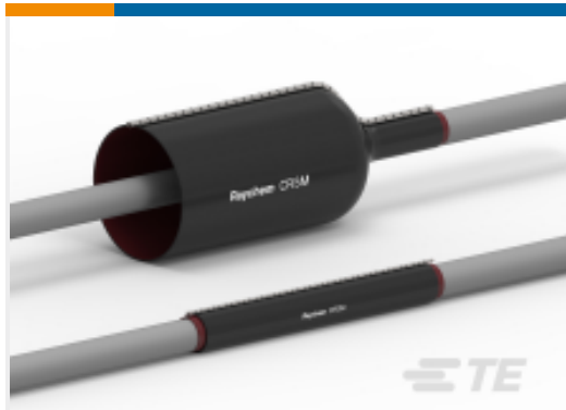
TE 产品编号406345-000 CRSM-34/10-1000/239(S5)