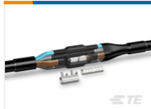
TE 产品编号CZ0818-000 LJSU-5X004-016