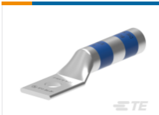
TE 产品编号EN3750-459 TCTL-3/0-1/2-U