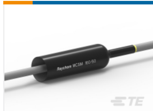
TE 产品编号CU5152-000 厚壁热缩管