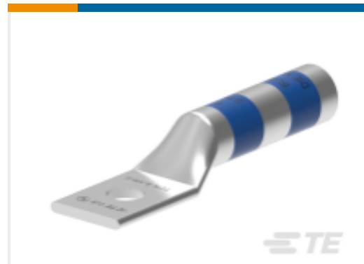
TE 产品编号EN3750-461 TCTL-350-1/2-U