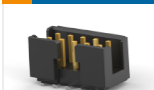
TE 产品编号1-2373376-0 10P,2MM,SHRD HDR,DRVT,SMD,0.1 AU,TB