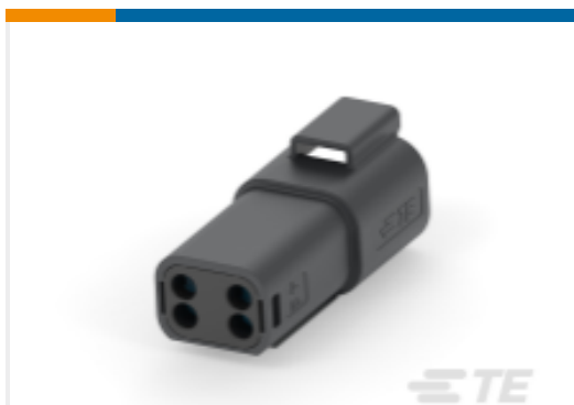
TE 产品编号1-2600030-0 4CCT BLACK RECEP W/LARGE SEAL